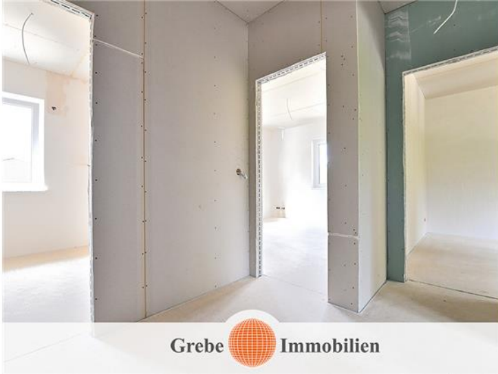
Flur im DG